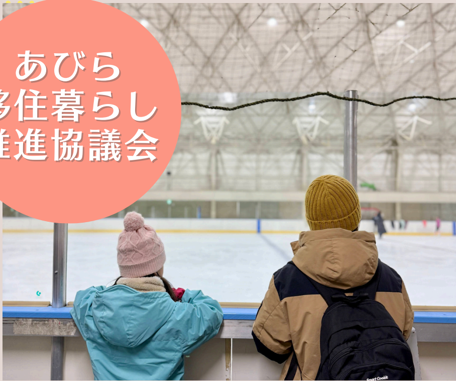
～令和7年1月に行われた現地移住ツアーの様子～