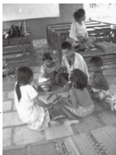
お父さんと子どもたち

そして何日かしておやつの日になりました。子どもたちに手伝わせながらおやつを作るお母さん。そして嬉しそうに食べている子どもたちを、目を細めて見ているお母さん。まるで本当のお母さんのように映りました。このようにして施設はついに大きな家庭・大きなファミリーとなつていったのです。