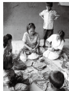
ちまきを作る子どもたち